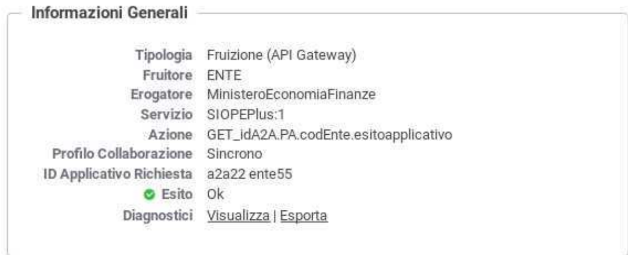
Figura 7: Dettaglio Transazione con ID Applicativo Richiesta

Consultando il dettaglio della transazione è possibile visualizzare l'intero identificativo estratto, tra le proprietà dell'elemento (Figura 7).