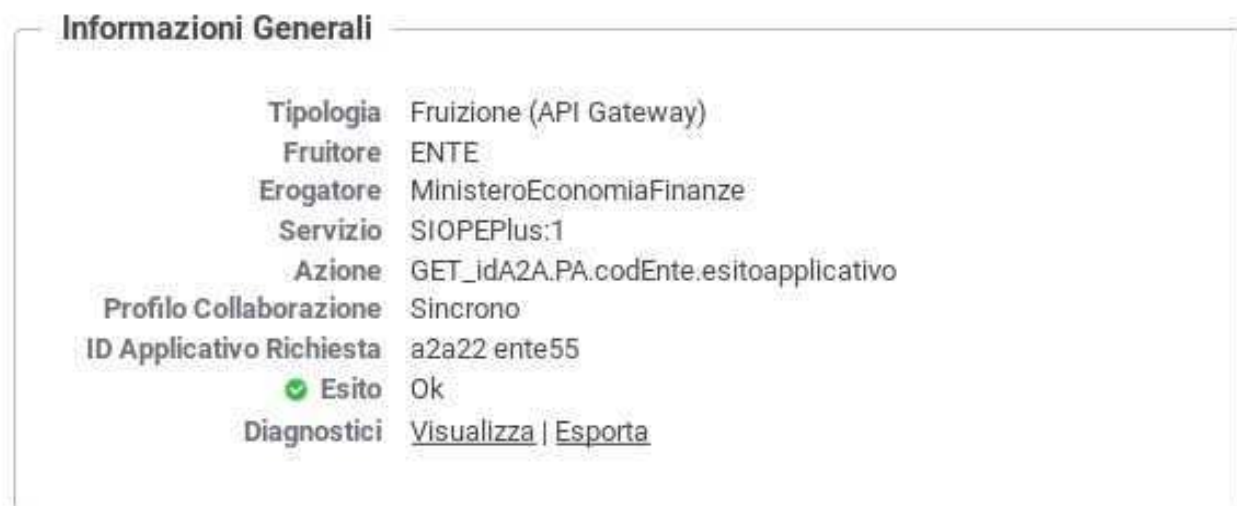
Figura 7: Dettaglio Transazione con ID Applicativo Richiesta

Consultando il dettaglio della transazione è possibile visualizzare l'intero identificativo estratto, tra le proprietà dell'elemento (Figura 7).